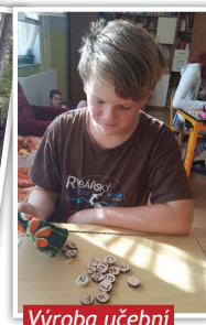
Výroba učební pomůcky