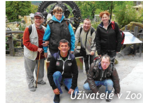
Uživatelé v Zoo

První říjnový víkend se uživatelé našich služeb vydali s doprovodem na návštěvu zoologické zahrady v pražské Troji. Moderní zahrada, která ukazuje zvířata v podmínkách, které se co nejvíce blíží jejich přirozenému prostředí, se jim velice líbila. Se zájmem si ji celou prošli a viděli jak žijí sloni, čápi, gorily, levharti, tučňáci, žirafy, lachtani a další zvířata. Naši uživatelé zde strávili pěkný den.