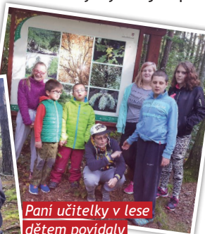
Pani učitelky v lese dětem povídaly o rostlinách i houbách