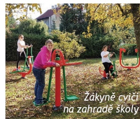
Žákyně cvičí na zahradě školy

Díky finančnímu daru od Diplomatic Spouses Association jsme mohli na zahradu školy v Unhošti