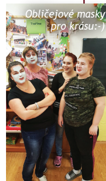
Obličejové masky pro krásu:-)

Jako odměnu za to, jak byly děti ve stochovské škole v předvánočním období hodné a pracovitě, jsme pro ně v pátek 5. ledna udělali relaxační den, který jsme velkoryse nazvali "wellness den". Pustili jsme relaxační hudbu a připravili několik stanovišť - masáž, péče o obličej, relax pro chodidla, kadeřnictví či kosmetiku. Nakonec děti trvaly na tom, že se připojí i učitelé. Na víkend jsme tak odcházeli krásní a odpočatí. A další týden už na nás opět čekaly školní povinnosti. Text: M. Jirásková