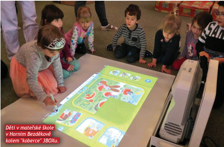
Děti v mateřské škole v Horním Bezděkově kolem "koberce" 3BOXu.