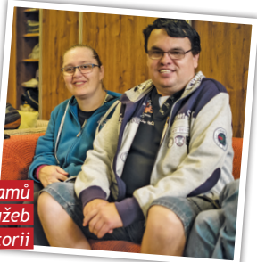
V rámci programů pro uživatele našich služeb si povídáme i o historii