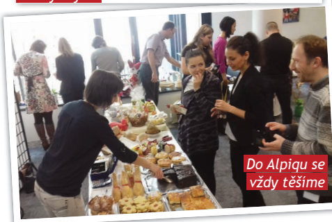
Do Alpiqu se vždy těšíme

chystá další z řady Pečení tentokrát spojené s vernisáží fotografií z kalendáře Slunce 2018, které budou nově zdobit Kavárnu Slunce. ■