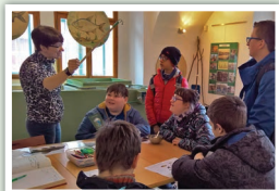
Na rybářské výstavě