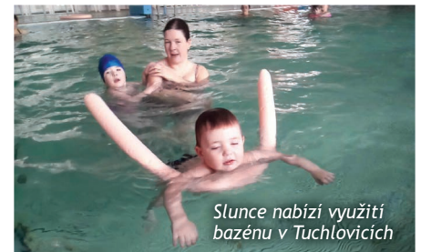
Slunce nabízí využití bazénu v Tuchlovicích

Každou neděli od 8 do 9 hodin mohou zaměstnanci Slunce a uživatelé služeb se svými rodinnými příslušníky, i žáci školy se svými rodiči zdarma využít bazénu v Tuchlovicích a jít si zaplatvat. Voda je příjemně teplá a plavání zdravé, přijďte.