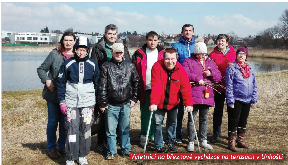
Výletníci na březnové vycházce na terasách v Unhošti