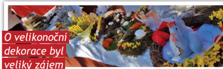
O velikonoční dekorace byl veliký zájem

Zároveň máme radost, jak velký zájem je i letos o naši tradiční akci Pečení pro dobrou věc v Unhošti. Určitě k tomu přispívá vynikající pečivo z cvičné pekárny a štěstí jsme měli i na počasí. V únoru a březnu nám sluníčko svítilo celý den. Již 18. dubna se