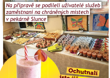
Na přípravě se podíleli uživatelé služeb zaměstnaní na chráněných místech v pekárně Slunce