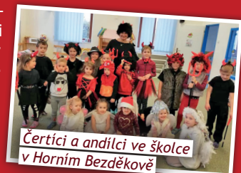
Čertci a andělci ve školce v Horním Bezděkově

Ani sluneční škola, školka i centrum služeb nebyly ušetřeny a začátkem prosince tam dorazila mikulášská družina. Byla však hodná:-) Čerti nikoho neodnesli a Mikuláš rozdával zasloužené dobroty. Na Stochově si udělali čertovskou besídku naruby. Za anděla, čerta a Mikuláše se převlékli naši žáci a básničku odříkávaly paní učitelky. Mikuláš a dva andělé z firmy Aramark dorazili i mezi děti do školy v Unhošti. A pozadu nezůstaly ani děti ze školky a uživatelé z centra.