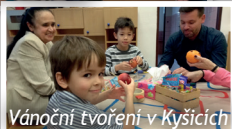
Vánoční tvoření v Kyšicích