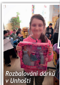
Rozbalování dárků v Unhošti

Nakonec se děti dočkaly a pátek před prázdninami se po slavnostních obědech nadělovalo i ve Slunci. Děkujeme