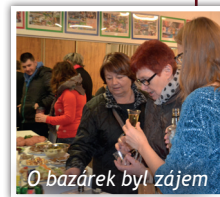
O bazárek byl zájem

Poslední Pečení pro dobrou věc tohoto roku bylo spojené s bazárkem věcí do domácnosti i oblečení. Byla tak možnost koupit pěkné dárky na poslední chvíli. Bazar zahájily pěkným vystoupením děti z naší mateřinky. Celý den se povedl a na bazaru se vybralo přes 16 tis. Kč.