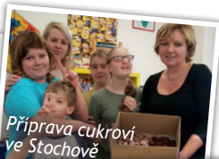
Příprava cukroví ve Stochově