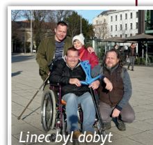
Lincec byl dobyt

V polovině prosince se vydali uživatelé našich služeb na výlet do adventního Lince, kde obdivovali krásy rakouského města, vyrazili na vánoční nákupy a jini zase navštívili místní památky a vyjeli na Pöstlingberg s nádherným výhledem na město i vzdálené vrcholky Alp.