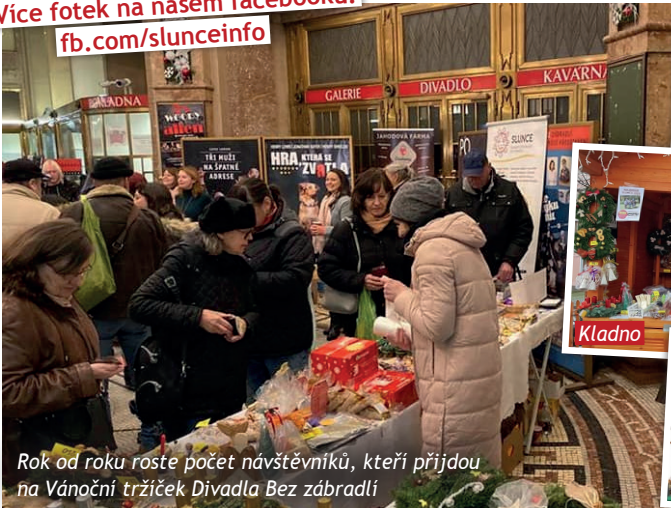
Rok od roku roste počet návštěvníků, kteří přijdou na Vánoční tržiček Divadla Bez zábradlí

► Více fotek na našem facebooku: fb.com/slunceinfo