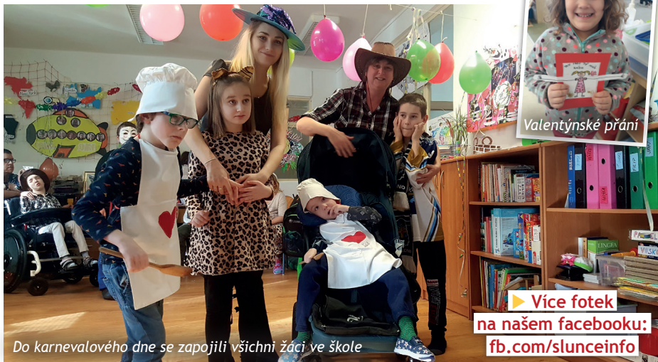
Do karnevalového dne se zapojili všichni žáci ve škole