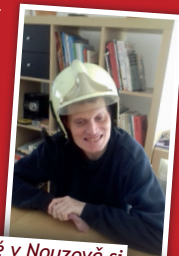
Uživatelé v Nouzově si vyzkoušeli hasičskou helmu

Požární prevence je pro nás důležitá. S klienty v Domově dobré vůle Slunce v Nouzově, ale i ostatními uživateli našich služeb i dětmi ve škole opakovaně probíráme chování při požáru a připomínáme si pravidla, která jsou potřeba dodržovat. Prevenci samozřejmě přizpůsobujeme individuálním schopnostem a možnostem každého našeho klienta.