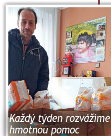
Každý týden rozvážíme hmotnou pomoc

Pomoc potravinové banky v podobě plen jsme v únoru směřovali i do Dětského domova v Kladně, kde jsou potřeba ve velkém. Každý týden také potravinami podporujeme lidi v nouzi.