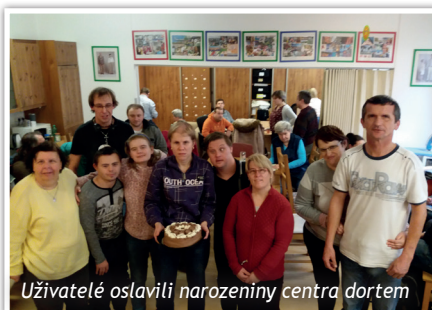
Uživatelé oslavili narozeniny centra dortem

Dnes centrum poskytuje neuvěřitelných 11 sociálních služeb, je moderním, profesionálním zařízením, které své klienty co