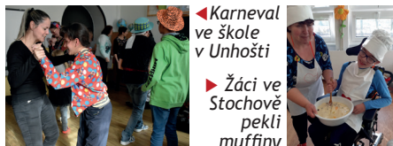
◀ Karneval ve škole v Unhošti

Každý týden pořádáme za podpory MŠMT Klub zábavné logiky a deskových her. Žáci se zábavnou formou v uvolně-