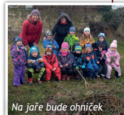
Na jaře bude ohniček

Vichřice Sabine se prohnala naší republikou a na zahradě školky v Kyšicích zanechala spousty spadných větví. Děti se proměnily v pracovité mravenečky a co jim síly stačily, odnosily větve k ohništi. A hned bude na čem si na jaře péct buřty.