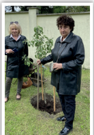
Zasadili jsme vzpomínkové stromy