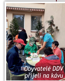
Obyvatelé DDV přijeli na kávu

Na srpnové Pečení pro dobrou věc, které se opět vydařilo, dorazili i obyvatelé Domova dobré vůle Slunce v Nouzově. V kavárně si dali kávu a zákusek, poseděli a pozdravili se se svými kamarády. Děkujeme i vám všem, kteří jste přišli a podpořili nás. Jste zváni na Pečení zářijové.