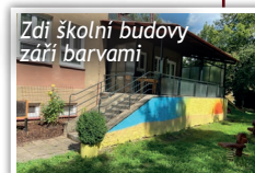
Zdi školní budovy září barvami

Díky projektu Barvy boří zeď nám začíná barvami zářít fasáda stochovské školy. Zeď bude pomalovaná obrázky, které odkazují na školní vzdělávací program Cesta kolem světa. U dětí by měly barvy navozovat pozitivní náladu a pomoci překonávat bariéry. Počítáme, že během podzimu se do malování obrázků zapojí i samotní žáci.