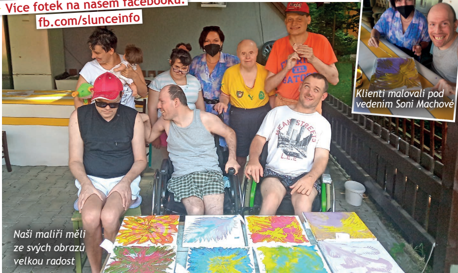
Naši malíři měli ze svých obrazů velkou radost

► Více fotek na našem facebooku: fb.com/slunceinfo