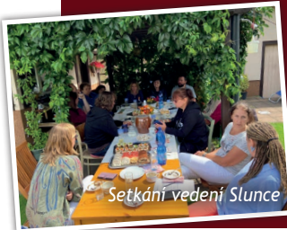
Setkání vedení Slunce