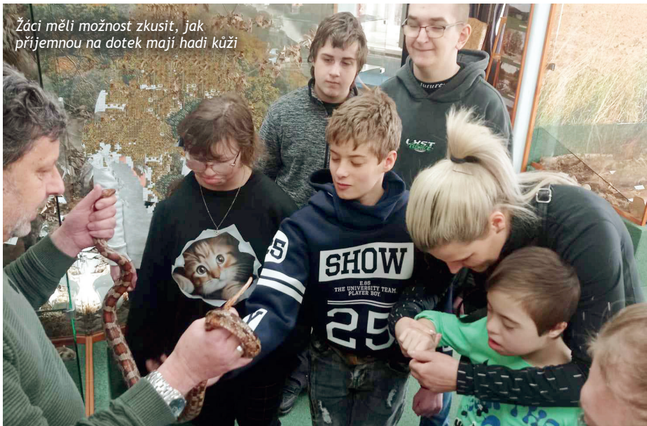
Žáci měli možnost zkusit, jak příjemnou na dotek mají hadi kůži