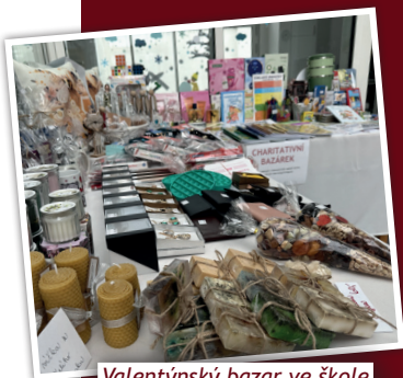
Valentýnský bazar ve škole proběhne od 7. do 16. února

Po velkém úspěchu vánočního bazaru jsme se rozhodli umístit do atria školy v Hájecké ulici v Unhošti stálý charitativní bazárek. Zakoupíte tu různé dárkové předměty, výrobky od klientů a dětí a nechybí ani pracovní a školní pomůcky, které nabízíme v rámci našeho speciálně pedagogického centra. Nabídku budeme obměňovat podle svátků, které nás čekají. Od 7. února se můžete těšit na výrobky ke svatému Valentýnu, následovat bude od 20. března velikonoční bazárek. Pokud nás budete chtít podpořit a zároveň si udělat radost nákupem, můžete se stavit kdykoliv ve všední dny mezi 8 a 15 hodinou. Zaplatit můžete hotově nebo kartou.